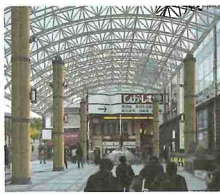
▲ 近鉄奈良駅行基広場大屋根設置工事設計業務