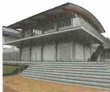
▲ 上野公園防災力強化棟新築工事